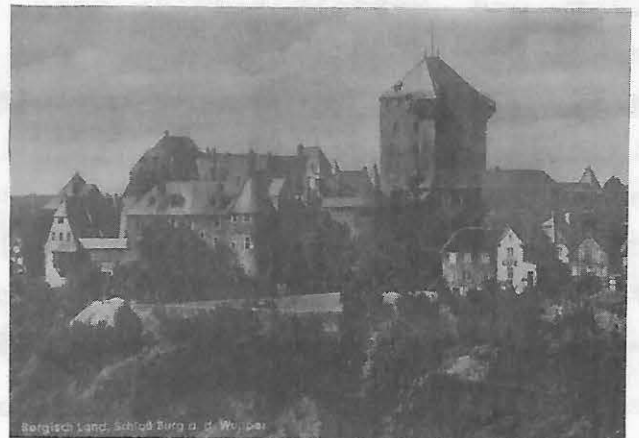
S C H L O ß B U R G

Die andere Gruppe hat die Möglichkeit, nach SCHLOß BURG zu fahren. Es handelt sich dabei um ein weitbekanntes, landschaftlich wunderschön gelegenes Schloß, in welchem sich ein interessantes Museum befindet. In der Nähe des Schlosses ist ein Sessellift, welcher über die Wupper und zurück führt.